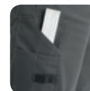
Duimstokzak met lus