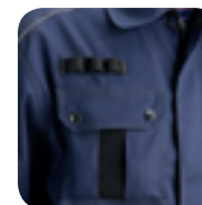
Borstzak met balpenlusjes