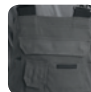
Grote borstzak met GSM-zakje