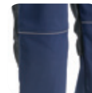
Reflecterende paspel achteraan