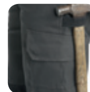
Dijbeenzak met 2 opgestikte zakjes