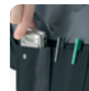
GSM-zakje met klep, verborgen drukknoop en 2 balpenzakjes