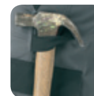
Hamerlus met drukknoop