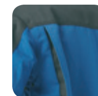
Gemaksplooi in de rug van het jack en de overall