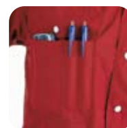
GSM-zakje en balpenzakjes